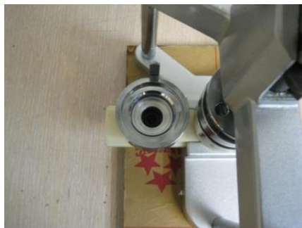
Нижняя насадка задней части