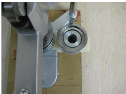
Нижняя насадка лицевой части