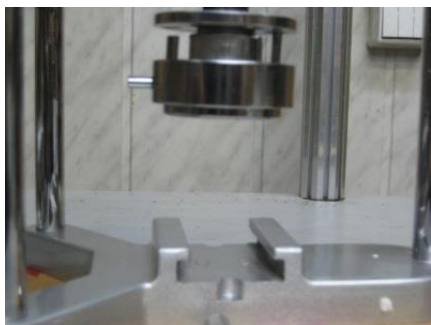
Установите верхнюю насадку